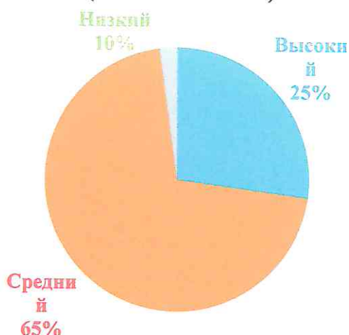
РЕЗУЛЬТАТЫ ОБСЛЕДОВАНИЯ 10 СТАРШЕЙ ГРУППЫ КОМПЕНСИРУЮЩЕЙ НАПРАВЛЕННОСТИ (СЕНТЯБРЬ 2021)