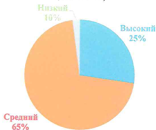
РЕЗУЛЬТАТЫ ОБСЛЕДОВАНИЯ 10 СТАРШЕЙ ГРУППЫ КОМПЕНСИРУЮЩЕЙ НАПРАВЛЕННОСТИ (МАЙ 2021)